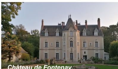
Château de Fontenay.

aux cyclistes la Maison du Passeur, « café éphémère ». Brûlé par les Prussiens en 1871, reconstruit, le château est réputé pour ses vins, touraine et touraine chenonceaux. Trois des quatre parcours route (à l'exception du 43 km) pousseront la porte du domaine de Fontenay, qui sera un de nos « points de convivialité ». ■