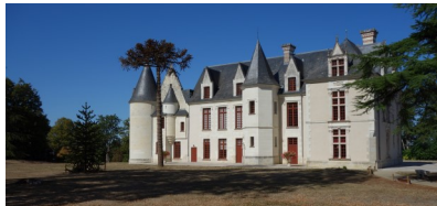
Château de Cangé.

La Cyclo-découverte® du samedi, à l'intention des licenciés FFCT, vous conduira dans le parc de Cangé (15 ha), propriété de la commune de Saint-Avertin depuis 1980. Le château accueille la médiathèque. En juin 1940, il abrita pendant quelques jours le Président Albert Lebrun, ainsi que la