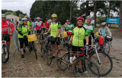
Saint-Laurent-Nouan, challenge du Centre 2021.

Les cyclotouristes de l'Orléanais sont un peu plus de 2 000 lorsqu'est décidée la création du challenge du Centre, en 1976. Ils sont 6 000 aujourd'hui. La Ligue adopte le principe de six randonnées régionales annuelles, une dans