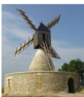
Moulin des Aigremonts.