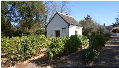
Vignoble et loge de vigne au carrefour du Noble Joué.

Le challenge du Centre 2022 est accueilli dans la 5 e ville d'Indre-et-Loire. Aux portes de Tours, dont la sépare le Cher, elle compte 15 450 habitants (chiffres de 2021). Elle doit son nom, porté depuis 1371, à un moine écossais, Aberdeen (traduit en Avertin), qui vécut en ermite en Touraine, à la fin du XII e siècle.