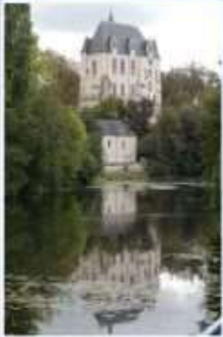
Château Raoul (Châteauroux)