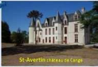
St-Avertin château de Cange