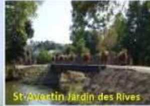
St-Avertin Jardin des Rives