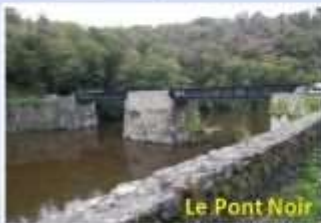
Le Pont Noir