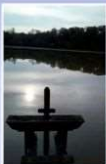
Les Etangs de Sologne