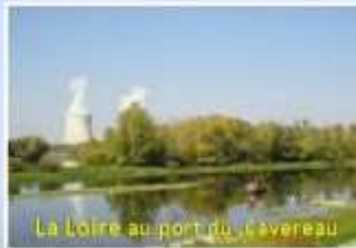
La Loire au port du Caverneau