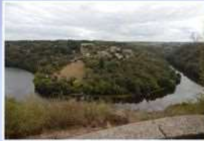
La Boucle du Pin