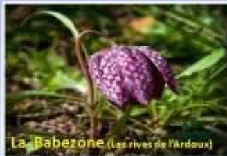
La Babezone (Les rives de l'Ardenne)