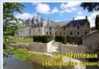
Les Grotteaux (Huisseau-St-Gosson)