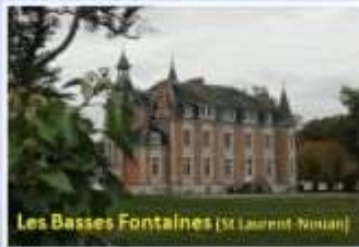
Les Basses Fontaines (St-Laurent-Nouan)