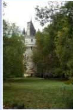
La Chaise Saint-Eloi (Monnay)