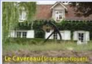
Le Caverneau (St-Laurent-Nouan)