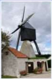
Le Moulin St-Jacques Nouan-Sur-Loire